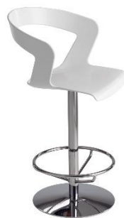
Barhocker Einsäulig MIDI IBIS ME.303B