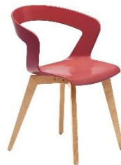
Stuhl mit Holzgestell IBIS ME.139