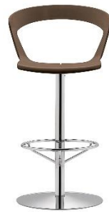
Barhocker Einsäulig IBIS ME.303