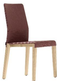
Stuhl mi hoher Rückenlehne Dalton ME.662