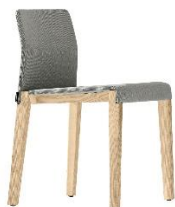
Stuhl Dalton ME.661