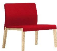
Lounge-Stuhl Dalton ME.663