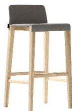
Barhocker Dalton ME.664